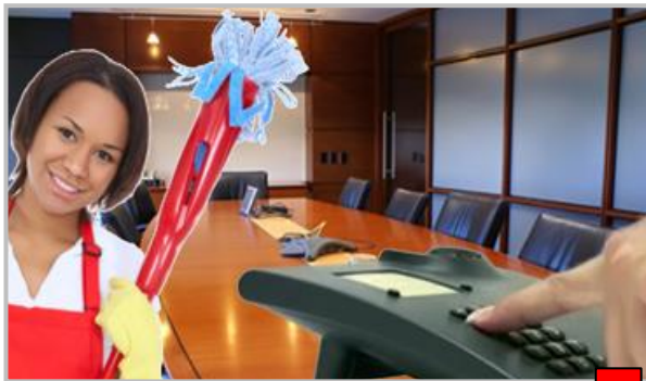
Votre intervenant, sur Site

Le logiciel identifie alors le site grâce au numéro appelant, et l'intervenant grâce au code personnel composé. SoftyCall peut être livré avec une application web de consultation des pointages, ou avec le logiciel SoftyPlanning (plusieurs options possibles).