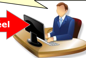
Vous, au Bureau